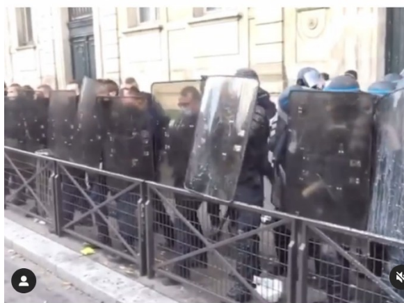
devant le lycée Colbert à Paris le 3 novembre 2020