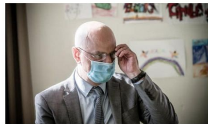
Le ministre de l'Éducation nationale.

Une organisation lycéenne favorable à l'exécutif a reçu 65 000 euros de subventions du ministère en 2019, dont 40 000 pour un congrès qui n'a jamais eu lieu. À sa tête, on a plutôt dégainé la carte bleue pour des frais de bouche et d'hôtels. Alertée, la rue de Grenelle, loin de couper les vivres, a réservé au syndicat 30 000 euros supplémentaires pour 2020. Révélations.